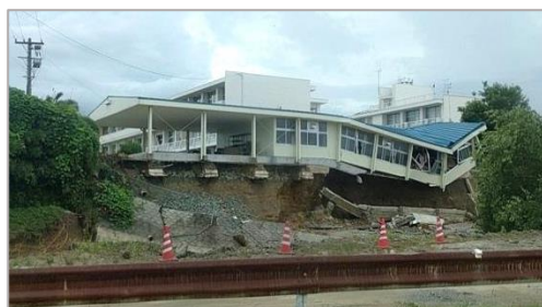
被害を受けた学校施設(朝倉)