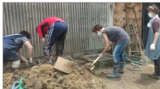
復旧作業をされる住民の方々(杷木)