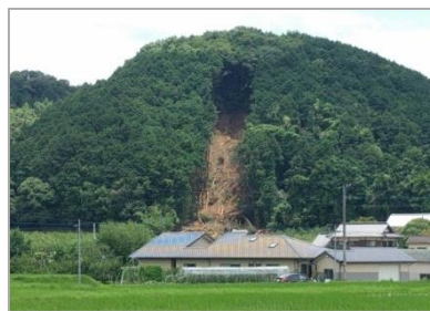
民家裏の山崩れ(朝倉)