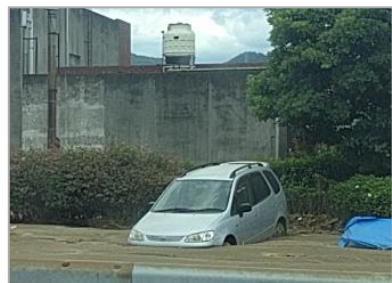
土砂に埋まった車(杷木)